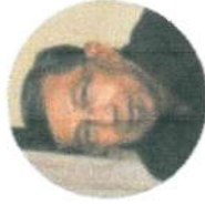
Prof. Dr. Ir. H. Gusti Muhammad Hatta M.S. (Guru Besar ULM Banjarmasin)

Implementasi Blue Economy dalam Dunia Penerbitan Perguruan Tinggi